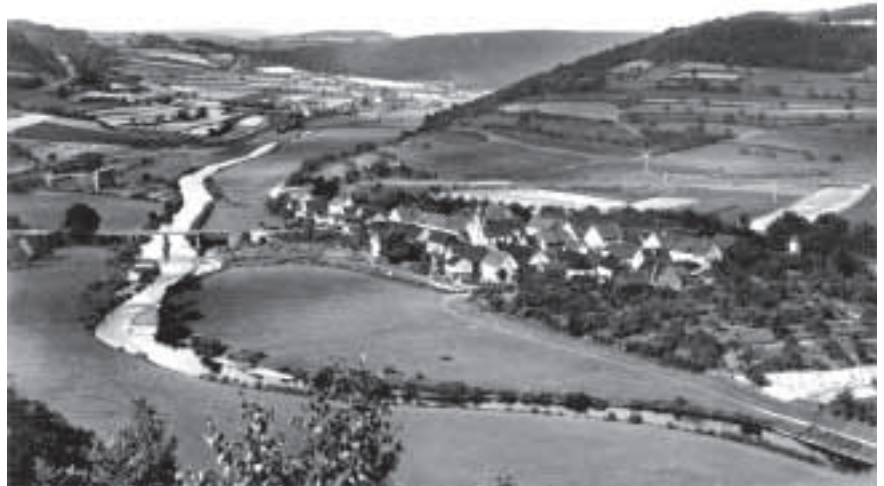
Abbildung 134: Brückenbaustelle Bw 144 mit Gräfendorfer Hang

Die Längsträger sollten als Vollwandbalken aus Stahl errichtet werden. Die Konstruktion war leicht zu berechnen, durch weitgehende industrielle